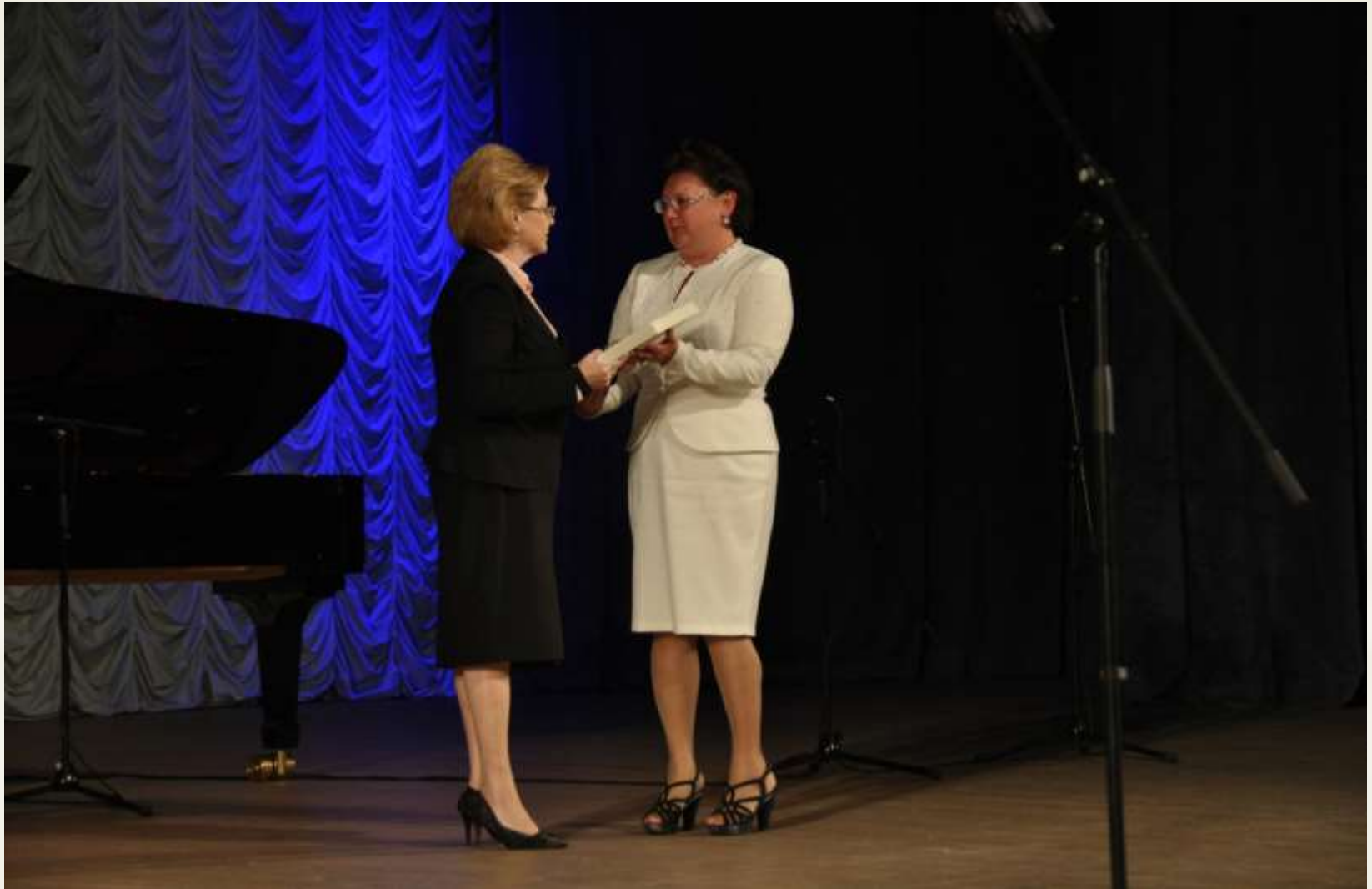
Награждение министром здравоохранения РФ Скворцовой В.И. за победу во всероссийском конкурсе в номинации «Лучший руководитель»