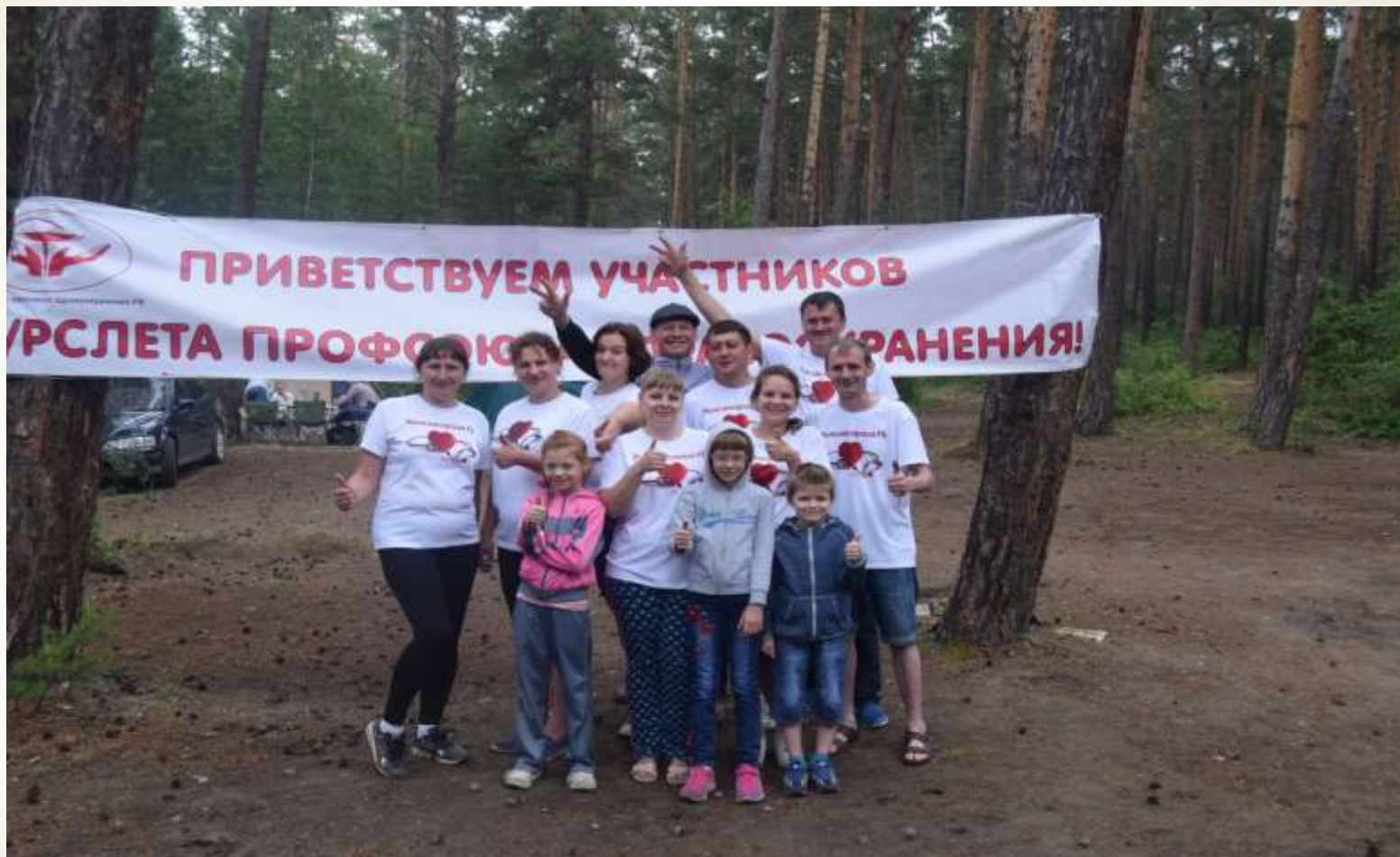
Турслет профсоюза работников здравоохранения 2019 год на Братском взморье. Команда Железногорской РБ