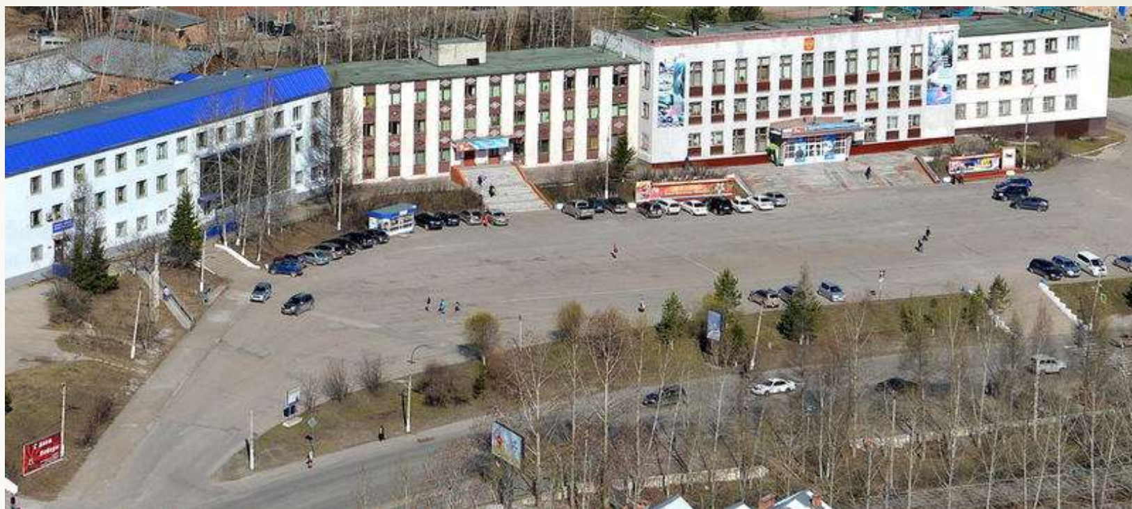
Административное здание г. Железногорска- Илимского.